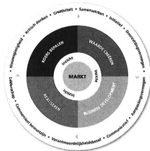
Figuur 1.1. Visualisatie van het landelijke CE beroepsprofiel (Dromen, Durven, Denken, Doen, 2018)

externe partijen tot het gewenste commerciële resultaat te komen. Tijdens de realisatie draagt hij zorg voor het commitment van stakeholders.